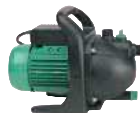
KS 1101 PA

P1 1100 watt Q max. 60 l/min H max. 47 m