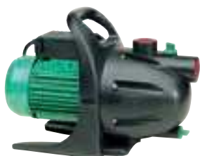
KS 1300 PA

P1 1100 watt Q max. 70 l/min H max. 49 m