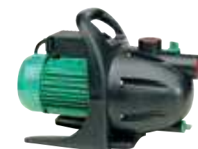
KS 1100 PA

P1 1100 watt Q max. 60 l/min H max. 47 m